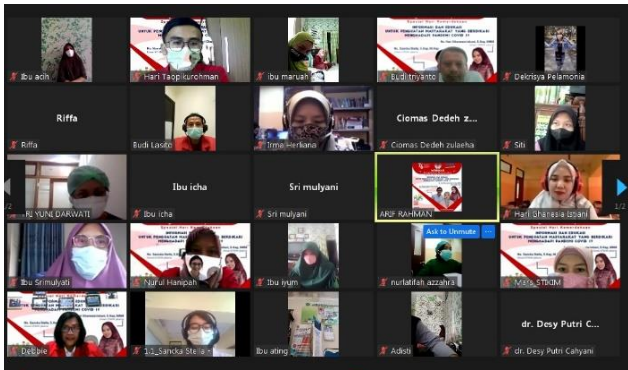
Gambar 1,2,3. Penyaji Memberikan Materi Sosialisasi Bepikir Kritis dan Melakukan Sesi Tanya Jawab (n=36)

Sosialisasi berpikir kritis yang dilakukan bagi warga masyarakat RT 01 RW 06 Desa Kota Batu mampu meningkatkan keterampilan kognitif dalam berpikir kritis. Diharapkan individu, keluarga, dan masyarakat mampu melakukan penyaringan tentang informasi yang merupakan berita yang benar dan berita bohong. Penggunaan gadget yang hampir dimiliki oleh setiap masyarakat harus berbanding lurus dengan kemampuan masyarakat untuk melakukan proses berpikir kritis sehingga masyarakat terhindar dari kebodohan dan dapat melakukan pencegahan dan perawatan secara tepat dalam menghadapi Covid-19. 13